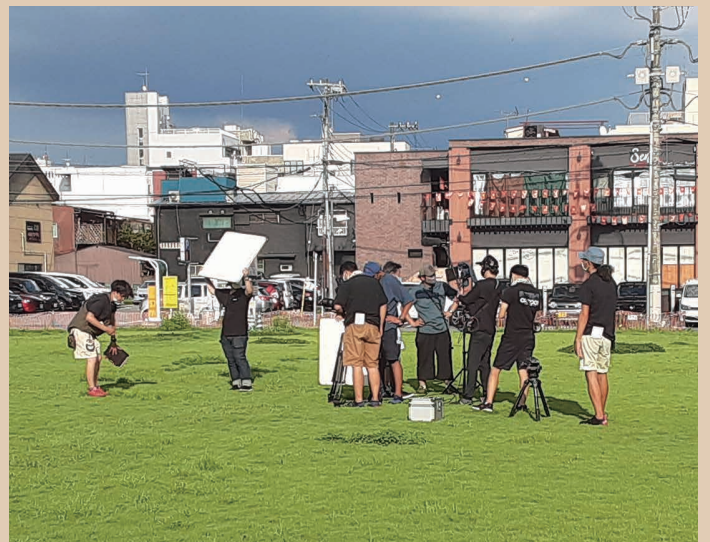
栃木県庁元栃木会館敷地での撮影風景